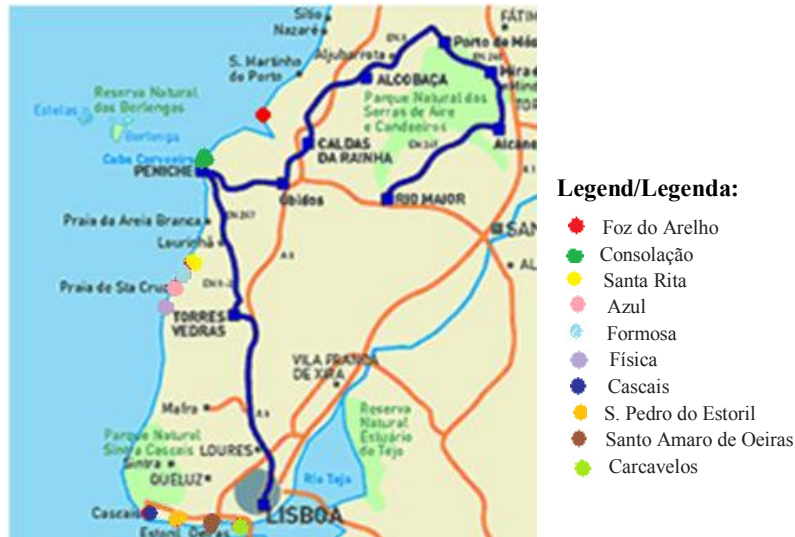
Figure 1 / Figura 1 – Beach Localities of Sample Collections Mapa Ilustrativo das Praias de Recolha das Amostras

Física, 2 da praia Formosa, 1 da praia Azul, 4 da praia de Santa Rita, 2 da Praia da Foz do Arelho, e 2 da praia da Consolação, totalizando 24 amostras. As amostras foram recolhidas num volume mínimo de 500 mL em frascos de vidro previamente esterilizados,