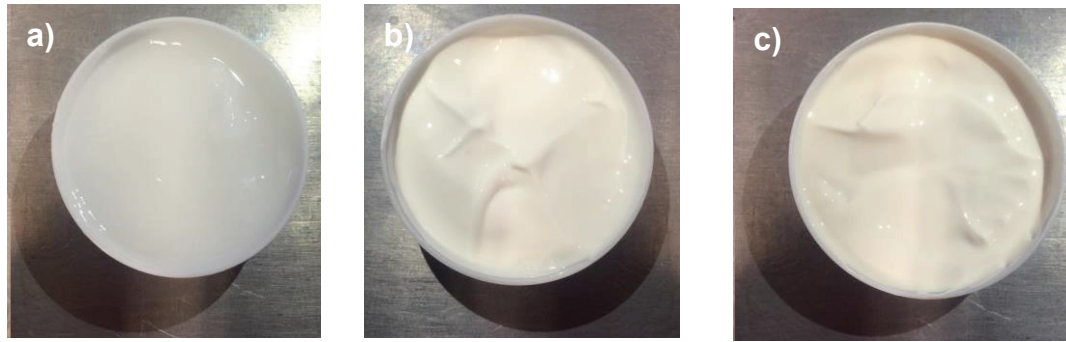
Figure 1/ Figura 1 – a) Placebo emulsion; b) Green tea emulsion; c) Black tea emulsion

a) Emulsão Placebo; b) Emulsão com chá verde; c) Emulsão com chá preto.